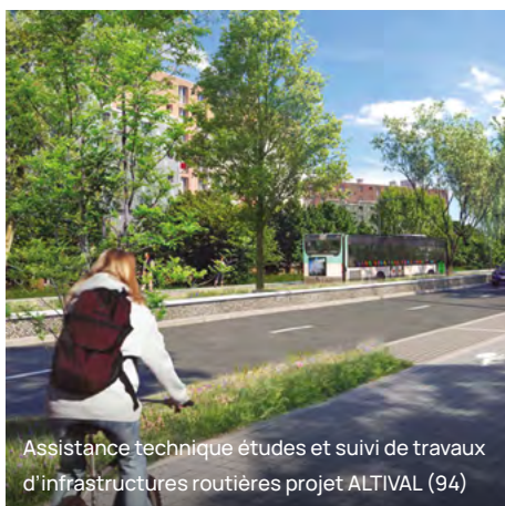
Assistance technique études et suivi de travaux d'infrastructures routières projet ALTIVAL (94)