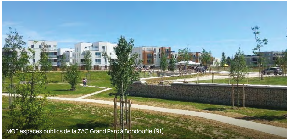
MOE espaces publics de la ZAC Grand Parc à Bondouffe (91)

PCM Aménagement Urbain & Infrastructures vous accompagne :