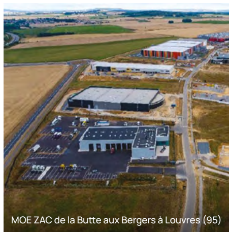
MOE ZAC de la Butte aux Bergers à Louvres (95)