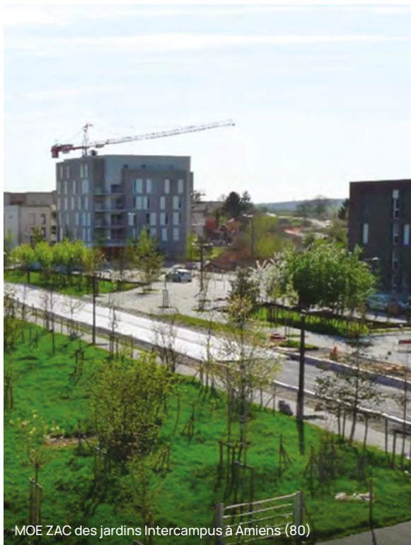
MOE ZAC des jardins Intercampus à Amiens (80)

PCM Aménagement Urbain & Infrastructures met à disposition des acteurs de l'aménagement du territoire son expertise en aménagement urbain, VRD, infrastructure routière et de transport.