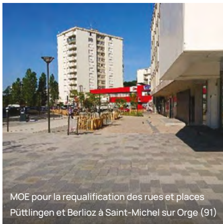
MOE pour la requalification des rues et places Püttlingen et Berlioz à Saint-Michel sur Orge (91)