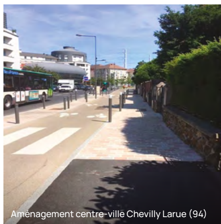
Aménagement centre-ville Chevilly Larue (94)