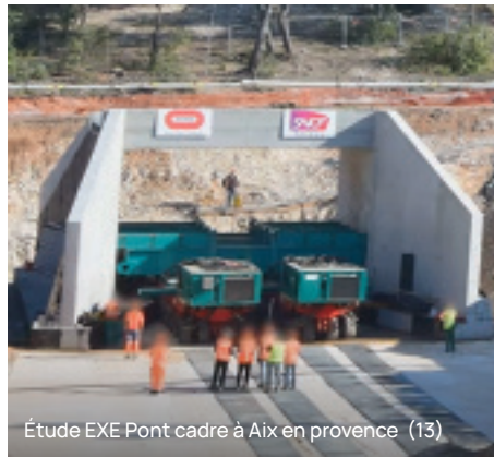
Étude EXE Pont cadre à Aix en provence (13)