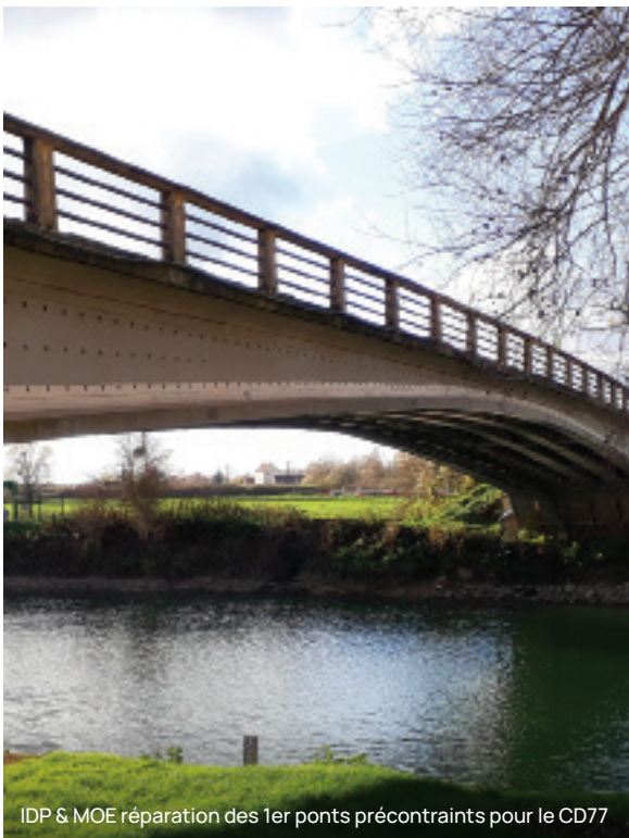
IDP & MOE réparation des 1er ponts précontraints pour le CD77

PCM Génie Civil & Ouvrages d'Art est un bureau d'études expert en conception d'ouvrages neufs et en réhabilitation – ponts, passerelles, mur de soutènements, écrans anti-bruit, Portiques Potence Haut Mat – et acteur de la surveillance des ouvrages d'art et du suivi de leurs maintenances.