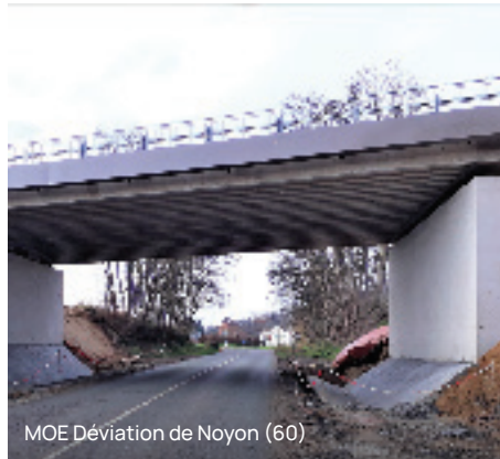
MOE Déviation de Noyon (60)