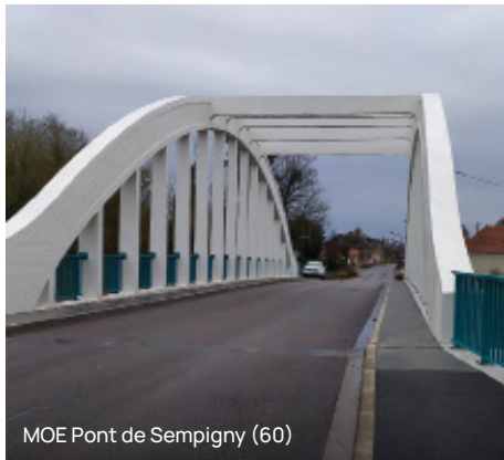
MOE Pont de Sempigny (60)