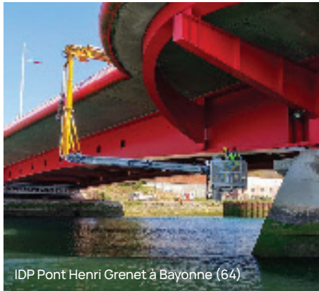
IDP Pont Henri Grenet à Bayonne (64)

PCM Génie Civil & Ouvrages d'Art vous accompagne :