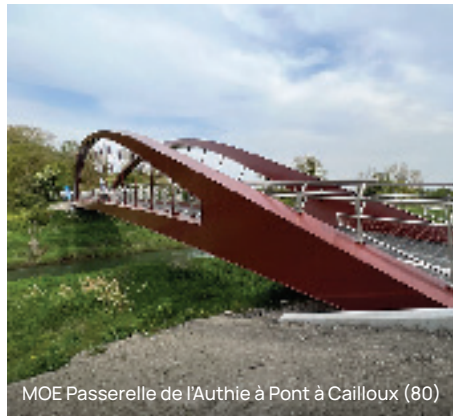
MOE Passerelle de l'Authie à Pont à Cailloux (80)