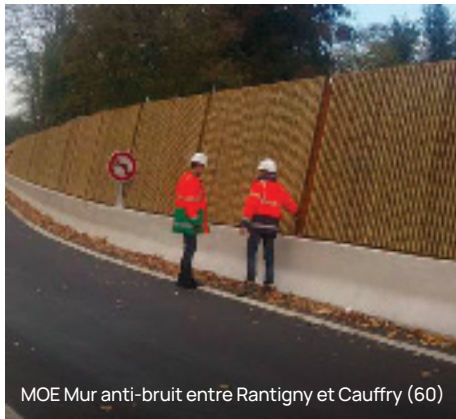
MOE Mur anti-bruit entre Rantigny et Cauffry (60)