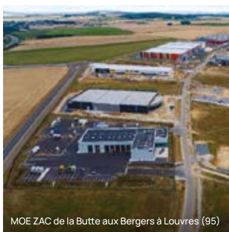
MOE ZAC de la Butte aux Bergers à Louvres (95)