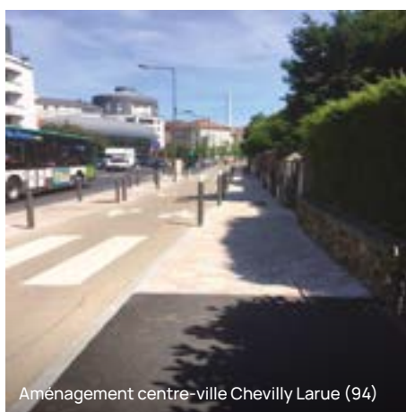
Aménagement centre-ville Chevilly Larue (94)