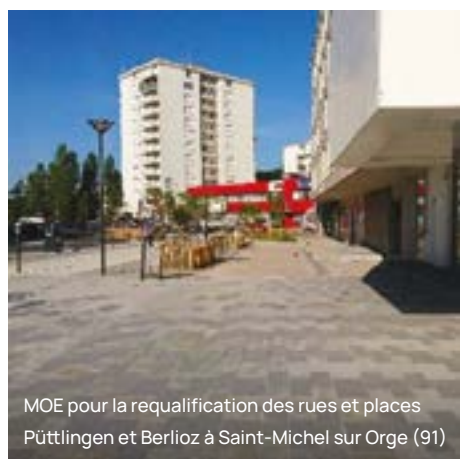
MOE pour la requalification des rues et places Püttlingen et Berlioz à Saint-Michel sur Orge (91)