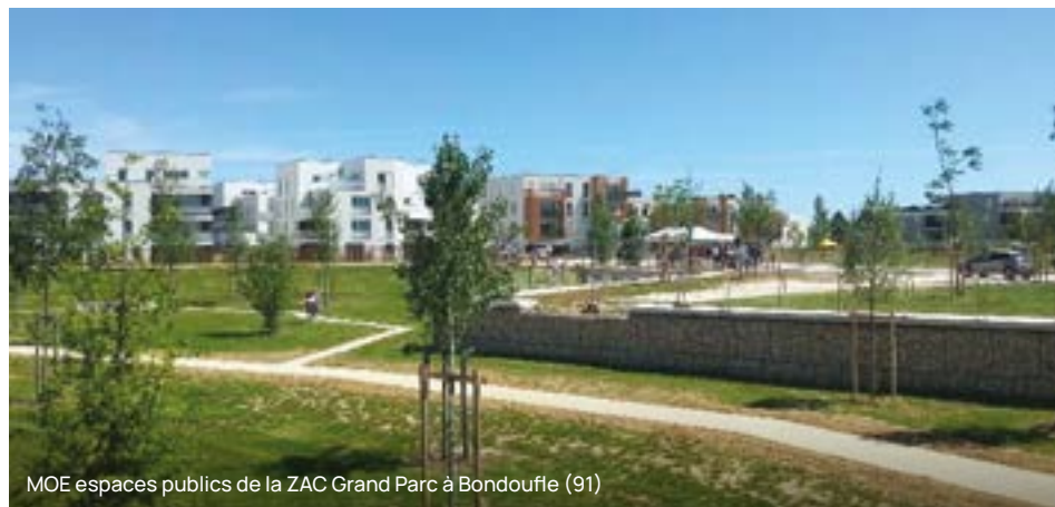
MOE espaces publics de la ZAC Grand Parc à Bondoufle (91)

PCM Aménagement Urbain & Infrastructures vous accompagne :