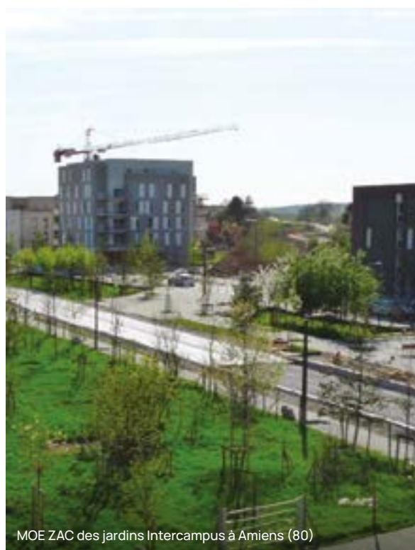
MOE ZAC des jardins Intercampus à Amiens (80)

PCM Aménagement Urbain & Infrastructures met à disposition des acteurs de l'aménagement du territoire son expertise en aménagement urbain, VRD, infrastructure routière et de transport.