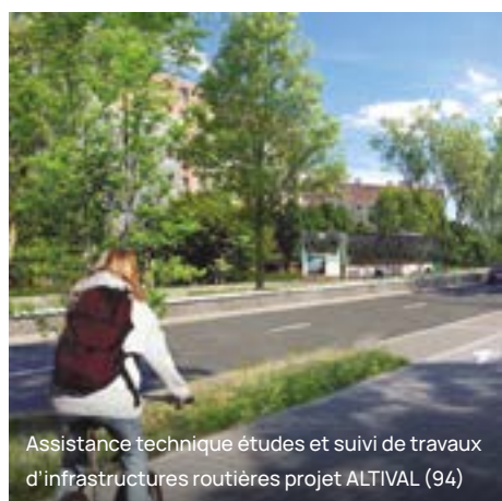
Assistance technique études et suivi de travaux d'infrastructures routières projet ALTIVAL (94)